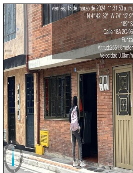
Ilustración 4. Sensibilización Casa a Casa

Finalmente, en el acercamiento con la comunidad se suscribieron actas de visita No. 027, 028, 029, 030 y 033 dejando como compromiso la disposición adecuada de residuos sólidos evitando su disposición en esquinas, postes u otro lugar diferente al domicilio teniendo en cuenta que incurrir en dicho comportamiento será objeto de aplicaciones de medidas correctivas tales como: