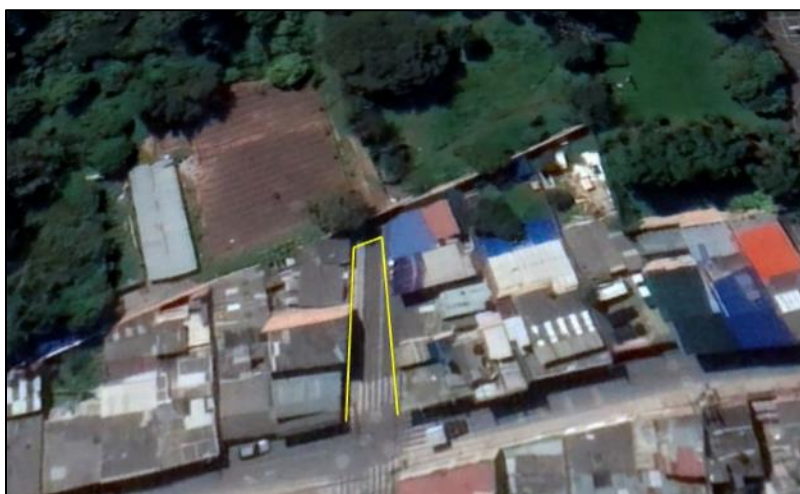
Ilustración 1. Ubicación de predios

Teniendo en cuenta que ante el municipio de Funza se interpuso queja por disposición inadecuada de residuos, el personal adscrito a la Secretaría de Ambiente y Bienestar Animal realizó vistas de control y vigilancia (Ruta amarilla) en el barrio Samarkanda con el fin de dar a conocer a la comunidad los comportamientos contrarios a la limpieza y recolección de residuos, así como las medidas correctivas a aplicar en caso de incurrir en alguno de dichos comportamientos. Se realizó visitas los días 15 de marzo y 31 de marzo del presente año, dichas visitas se realizaron desde las coordenadas 4°42'33" N-74°12'9" W hasta las coordenadas 4°42'32" N y 74°12'9" W, como se muestra en la siguiente ilustración: